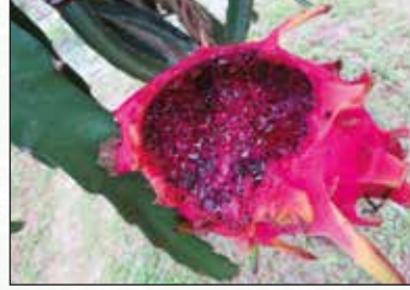
চিত্র-১৯: পাখির দ্বারা আক্রান্ত ফল