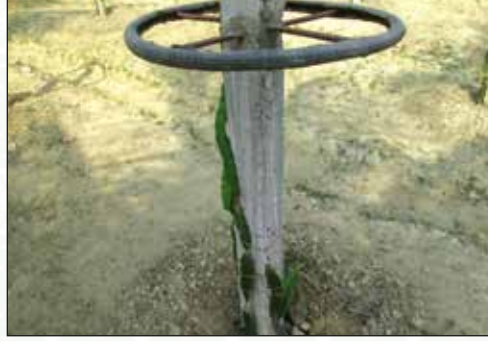
চিত্র-৮: সাইকেলের টায়ার পরিবেষ্টিত খুঁটির নমুনা

ড্রাগন ফল অত্যধিক শাখা প্রশাখাবিশিষ্ট একটি আরোহী (Climbing) লতা জাতীয় উদ্ভিদ। বিভিন্নভাবে এর বাউনী দেয়া যায় তবে ড্রাগন ফল যেহেতু কমপক্ষে ২০ বছর স্থায়ী হয় তাই কনক্রিটের টেকসই বাউনী