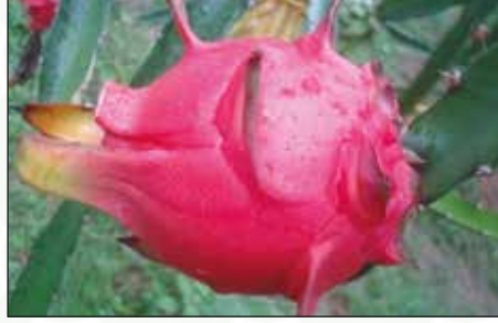
চিত্র-৪: বারি ড্রাগন ফল-১

এটি দ্রুত বর্ধনশীল বহুবর্ষী একটি আরোহী (Climbing) লতা জাতীয় উদ্ভিদ। কাণ্ড মাংসল, লতানো, অত্যধিক শাখা-প্রশাখা সমৃদ্ধ এবং সবুজ বর্ণের। কাণ্ড তিনটি খাজযুক্ত। প্রতিটি খাজের কিনারা আবার ৩-৫ সে.মি. পর পর খাজযুক্ত এবং এই খাজে ১-৩টি ছোট কাটা থাকে। কাণ্ড থেকে বায়বীয় মূল বের হয় যা কাণ্ডকে বাউনীর সাথে ধরে রাখে। উচ্চ ফলনশীল, নিয়মিত প্রচুর ফল দানকারী। ফলের ওজন ৩৫০-৪০০ গ্রাম।