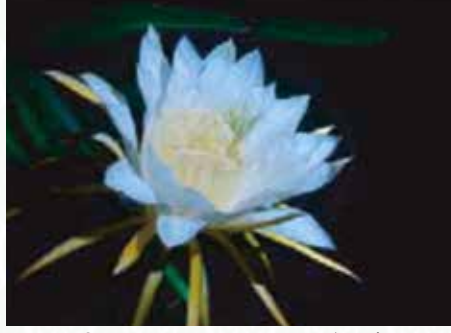
চিত্র-১: ড্রাগন ফুলের অপরূপ সৌন্দর্য

ড্রাগন ফল ( Hylocereus sp ) বাংলাদেশে ফল চাষে উজ্জ্বল সম্ভাবনাময় একটি ফল। এটি দ্রুত বর্ধনশীল ক্যাকটাস প্রজাতির বহুবর্ষী উদ্ভিদ। পৃথিবীর অনেক দেশে ফল উৎপাদন ছাড়াও শোভা বর্ধনকারী উদ্ভিদ হিসেবেও এর চাষ করা হয়। অনিন্দ্য সুন্দর ফুলের কারণে একে “সম্ভ্রান্ত নারী” অথবা “রাতের রাণী” নামেও ডাকা হয়। প্রসঙ্গত এর ফুল রাতে ফোটে এবং সকালে বন্ধ হয়ে যায়। ফুলের কলি আসার পর থেকে সাধারণত ১৪-১৫ দিনের মাথায় ফুল ফোটে। এপ্রিল মাসের শেষ সপ্তাহ থেকে নভেম্বর মাস পর্যন্ত ৫-৭ ধাপে ফুল আসে। ফুলের