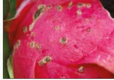
চিত্র-১৬: রোগাক্রান্ত ফল