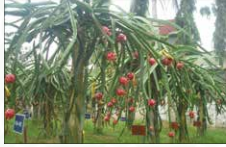
চিত্র-২: ড্রাগন ফল বাগানের চিত্র

নয়। এর ফলের আকৃতিও অদ্ভুত সুন্দর। ফলের গায়ে লম্বা আঁশ (বৃতি) থাকার কারণে একে ড্রাগন ফল নামকরণ করা হয়েছে। এই ফলের সবচেয়ে বড় সুবিধা হলো একবার গাছ রোপণ করে অন্তত ২০ বছর ফল পাওয়া যায় এবং হেক্টরপ্রতি ১৬০০ এর অধিক গাছ রোপণ করা যায়। সঠিক পরিচর্যা করলে ২য় বছর থেকেই ফল আসে। ফলের বাজার মূল্য উচ্চ হওয়ায় চাষাবাদ লাভজনক। এটি মূলত পাকা ফল ও শরবত হিসাবে খাওয়া হয়। অত্যন্ত আকর্ষণীয় রঙ এর কারণে এর শরবত জনপ্রিয়। এ থেকে জ্যাম, জেলি, জুস, আইসক্রিম ও ক্যান্ডি তৈরি করা যায়। লাল রঙের ড্রাগন ফল এন্টি-অক্সিডেন্ট সমৃদ্ধ। এছাড়াও এটি ভিটামিন এ, ভিটামিন সি, ভিটামিন ই, লাইকোপেন, ফসফরাস ও ক্যালসিয়াম সমৃদ্ধ। সম্ভাবনাময় এই ফলের চাষ কৃষক পর্যায়ে সম্প্রসারণের লক্ষ্যে বাংলাদেশ কৃষি গবেষণা ইনস্টিটিউটের