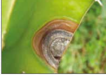
চিত্র-১৫: রোগাক্রান্ত কাণ্ড

এটি ড্রাগন ফলে একটি সাধারণ রোগ যা Colletotrichum gloeosporioides দ্বারা সৃষ্টি হয়। সাধারণত ভিজা আবহাওয়ায় রোগের সংক্রমণের হার বেশি।