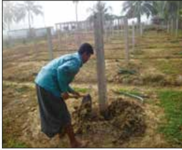
চিত্র-৯: চারা রোপণের জন্য খুঁটির গোড়ায় মাদা প্রস্তুতকরণ

সেচের ব্যবস্থা থাকলে সারা বছরই চারা রোপণ করা যায়। তবে বর্ষার পূর্বে সাধারণত মার্চ/এপ্রিল মাসে রোপণ করা ভালো। চারা রোপণের ১২-১৫ দিন পূর্বে প্রতি খুঁটির গোড়ায় ২০ কেজি পচা গোবরের সাথে ৩০০ গ্রাম টিএসপি ও