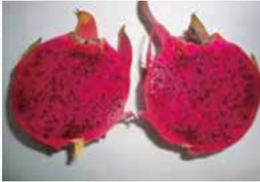
চিত্র-৫: বারি ড্রাগন ফল-১ এর লম্বচ্ছেদ

পাকাফল দেখতে হালকা গোলাপী রঙের। কাটলে ভিতরটা গাঢ় গোলাপী রঙের এবং রসালো, টিএসএস ১৩.২২%। খাদ্যোপযোগী অংশ ৮১%। তিন থেকে পাঁচ বছর বয়সী গাছ প্রতি ফলন ৩.২২ কেজি/বছর এবং ২০.৬ টন/হেক্টর/বছর। ফলে বেটা ক্যারোটিন ১২.০৬ মিলিগ্রাম/১০০ গ্রাম এবং ভিটামিন সি ৪১.২৭ মি.গ্রাম/১০০ গ্রাম থাকে।