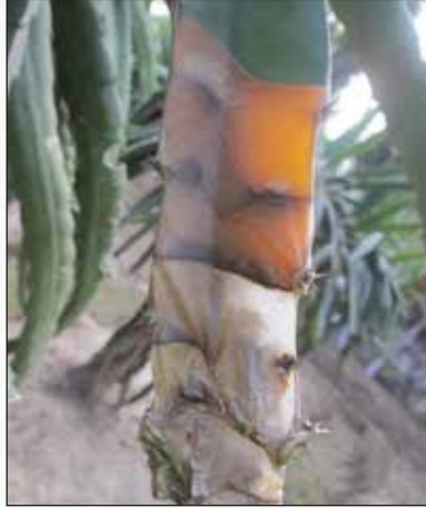
চিত্র-১৩: কাণ্ড ও ফল পচা রোগের লক্ষণ

এটি ড্রাগন ফলের প্রধান রোগ যা Xanthomonas campestris নামক ব্যাকটেরিয়া দ্বারা সংক্রামিত হয়। এছাড়াও তাইওয়ান ও মালয়েশিয়াতে Fusarium oxysporium , Pantoea sp ও Erwinia carotovora দ্বারা সংক্রামিত হবার নজিরও রয়েছে।