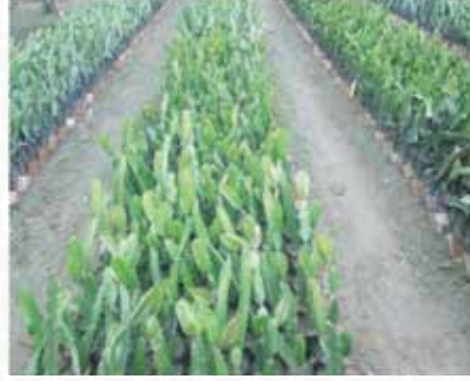
চিত্র-৭: শাখা কলমের মাধ্যমে চারা উৎপাদন

ড্রাগন ফলের বীজ ও শাখা কলম, উভয় মাধ্যমেই বংশ বিস্তার করা যায়। তবে বীজের মাধ্যমে তৈরি গাছ তার মাতৃ গুণ ধরে রাখতে পারে না তাই শাখা কলম ব্যবহার করা উত্তম এবং সহজ। সারা বছরই শাখা কলম কাটিং করা যায়। তবে ফসল সংগ্রহের শেষ মৌসুমে অর্থাৎ নভেম্বর-ডিসেম্বরে সবচেয়ে উপযুক্ত সময়। শাখা