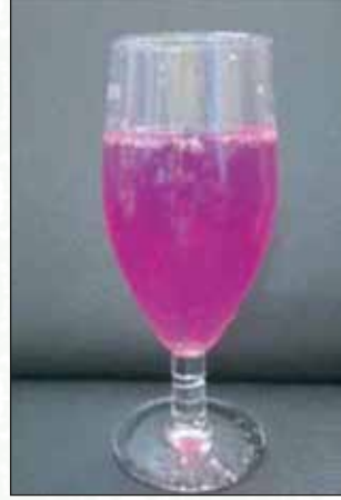
চিত্র-৩: বারি ড্রাগন ফল-১ এর তৈরি শরবত

মেক্সিকো এবং দক্ষিণ ও মধ্য আমেরিকা ড্রাগন ফলের উৎপত্তি স্থান। বাংলাদেশে ঢাকা, সাভার, উত্তরাঞ্চল, চট্টগ্রাম এবং পাহাড়ী অঞ্চলে ড্রাগন ফলের চাষ করা হচ্ছে। বর্তমানে ড্রাগন ফল মালয়েশিয়া, থাইল্যান্ড, ভিয়েতনাম, তাইওয়ান, শ্রীলঙ্কা, ইসরাইল, নিকারাগুয়া, অস্ট্রেলিয়া ও আমেরিকা সহ পৃথিবীর অনেক দেশে বাণিজ্যিকভাবে চাষাবাদ হচ্ছে।