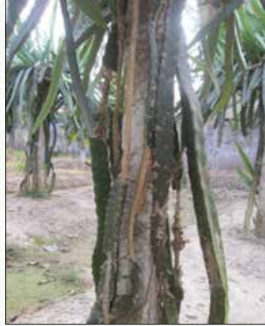
চিত্র-১৪: কাণ্ড ও ফল পচা রোগাক্রান্ত গাছ