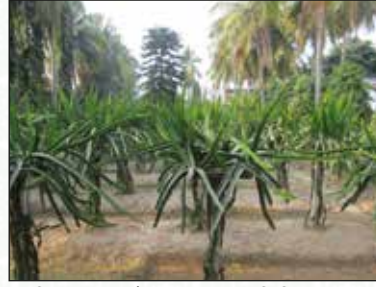
চিত্র-১২: পূর্ণবয়স্ক গাছের অতিরিক্ত শাখা ছাঁটাইকরণের পর নতুন কাণ্ড