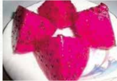
চিত্র-৬: বারি ড্রাগন ফল-১ এর ভক্ষণযোগ্য অংশ