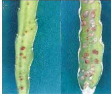
চিত্র-১৭: কাণ্ডে বাদামী দাগ রোগ

এই রোগের বাহক Botryosphaeria dothidea নামক ছত্রাক।