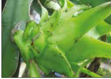
চিত্র-১৮: জাব পোকা আক্রান্ত গাছ

ড্রাগন ফলে তেমন কোন পোকার আক্রমণ হয় না এবং যেসব পোকা মাকড় দেখা যায় তারা মারাত্মক কোন ক্ষতি করতে পারে না। সাধারণত ছোট ও বড় পিঁপড়া, জাব পোকা, শামুক ও বিটল পোকা ফুলের কলিতে লক্ষ্য করা যায়। এছাড়া ফল পাকলে পাখির আক্রমণ হতে পারে।