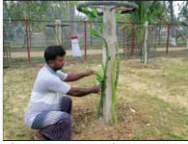
চিত্র-১১: চারা গাছের পার্শ্ব শাখা ছাঁটাইকরণ

দ্রাগন ফল দ্রুত বর্ধনশীল তাই ৩-৫ বছরে মধ্যে গাছের পরিমিত মাত্রায় শারীরিক বৃদ্ধি হয়ে যায়। গাছ খুঁটির মাচায় উঠার পূর্ব পর্যন্ত পার্শ্ব শাখা কেটে ফেলতে হবে। তিন বছর পর থেকে মাচার উপরের অতিরিক্ত শাখা ফল সংগ্রহের পর ডিসেম্বর মাসে কেটে পাতলা করে দিতে হবে। কারণ ঘন শাখা প্রশাখা বিভিন্ন পোকা মাকড় ও রোগ সৃষ্টিতে সহায়ক এবং আন্তঃপরিচর্যা ও ফল আহরণে প্রতিবন্ধকতা তৈরি করে। প্রতি ডিসেম্বরে ৫০ টির কাছাকাছি মূল শাখা এবং দুই একটি ২য় শাখা রেখে অন্য শাখাগুলো কেটে ফেলতে হবে। শাখা কাটার সময় অবশ্যই ৩য় ও ৪র্থ এবং রোগাক্রান্ত সব শাখাগুলোকে কেটে ফেলতে হবে। শাখা কাটার পর অবশ্যই ছত্রাকনাশক স্প্রে করতে হবে।