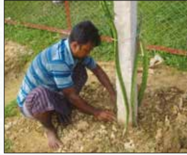
চিত্র-১০: প্রস্তুতকৃত মাদায় (খুঁটির গোড়ায়) চারা রোপণ