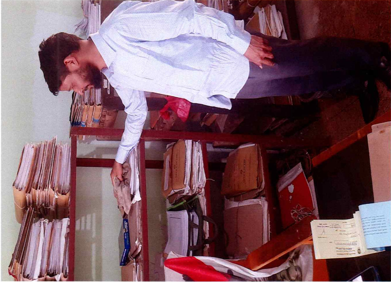
কর্ম পরিবেশ উন্নয়নের নিমিত্তে পরিচ্ছন্নতা কার্যক্রম, উপজেলা সমবায় কার্যালয়, চরফ্যাশন, ভোলা।