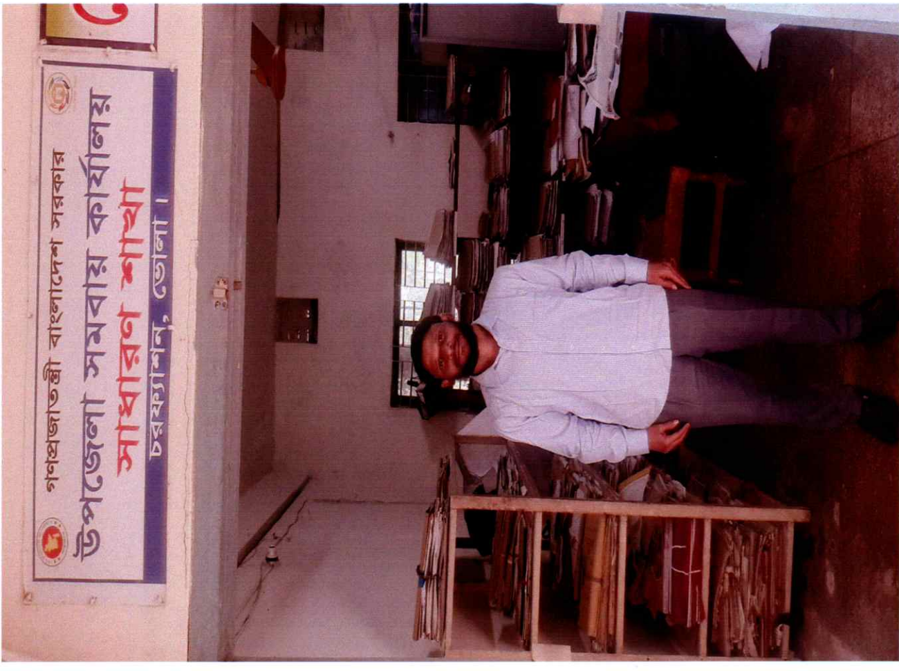
প্রাধিকার প্রাপ্ত ৪র্থ শ্রেণীর কর্মীদের দাপ্তরিক পোষাক পরিধান নিশ্চিত করণ, উপজেলা সমবায় কার্যালয়, চরফ্যাশন, ভোলা।