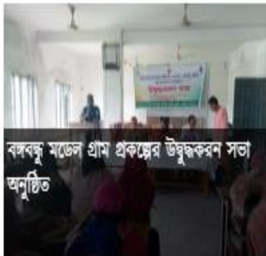
বঙ্গবন্ধু মডেল গ্রাম প্রকল্পের উদ্বুদ্ধকরণ সভা অনুষ্ঠিত