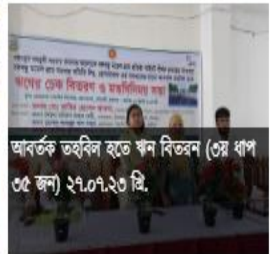
আবর্তক তহবিল হতে ঋণ বিতরণ (৩য় ধাপ ৩৫ জন) ২৭.০৭.২৩ খ্রি.