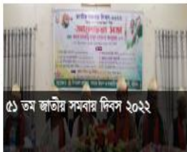
৫১ তম জাতীয় সমবায় দিবস ২০২২