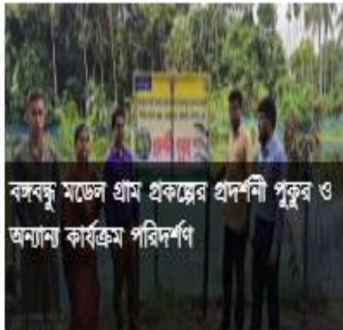
বঙ্গবন্ধু মডেল গ্রাম প্রকল্পের প্রদর্শনী পুকুর ও অন্যান্য কার্যক্রম পরিদর্শণ