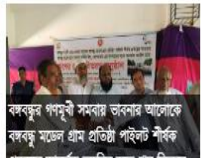
বঙ্গবন্ধুর গণমূর্তী সমবায় ভবন আর লোকে বঙ্গবন্ধু মডেল গ্রাম প্রতিষ্ঠা পাইলট শীর্ষক