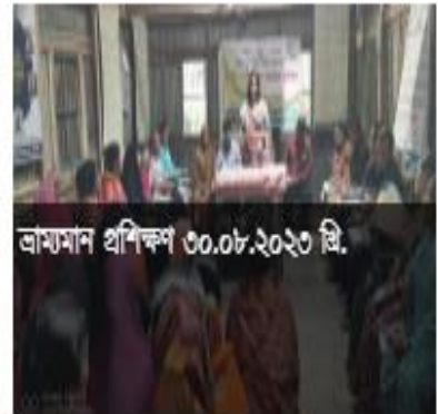
ভাষামান প্রশিক্ষণ ৩০.০৮.২০২৩ খ্রি.