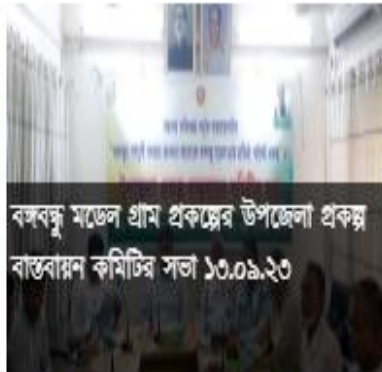
বঙ্গবন্ধু মডেল গ্রাম প্রকল্পের উপজেলা প্রকল্প বাস্তবায়ন কমিটির সভা ১৩.০৯.২৩