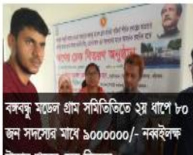
বঙ্গবন্ধু মডেল গ্রাম সমিতিতে ২য় ধাপে ৮০ জন সদস্যের মাঝে ৯০০০০০/- নকশাইলক