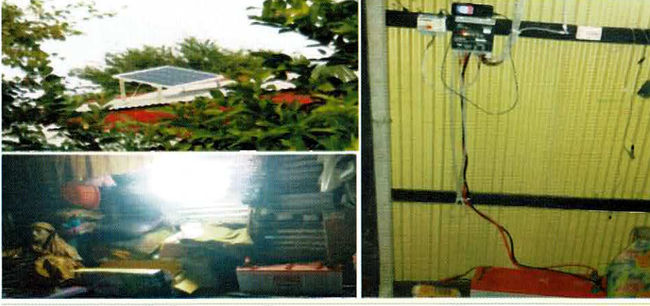
সোলার হোম সিস্টেমের মাধ্যমে বিদ্যুৎ সেবা পাচ্ছে চর কলাতলীতে বসবাসরত জনগণ

মুজিব বর্ষে শতভাগ বিদ্যুতায়ন কর্মসূচীর অংশ হিসাবে ওজোপাডিকো'র আওতাধীন ভোলা জেলার মনপুরার কলাতলী চরে কোম্পানির সামাজিক দায়বদ্ধতার অংশ হিসাবে ৮০০ টি পরিবারে ৮০০ টি সোলার হোম সিস্টেম (SHS) স্থাপন করা হয়েছে। প্রতিটি ৬৫ ওয়াট পিক স্টান্ড অ্যালন সোলার হোম সিস্টেমের মাধ্যমে উপকারভোগী পরিবার সমূহ কুপির পরিবর্তে সৌর বিদ্যুতের মাধ্যমে তাঁদের রাত্রীকালীন আলোর সুবিধা পাবেন। একই সাথে আরও প্রায় ৭০০ টি SHS স্থাপনের