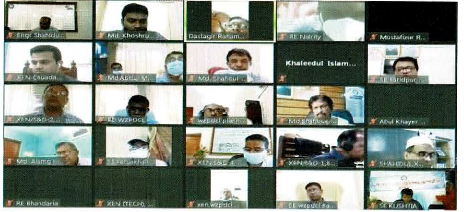
“PPA-2006 & PPR-2008” শীর্ষক প্রশিক্ষন কোর্সে Zoom Apps এর মাধ্যমে সংযুক্ত প্রশিক্ষক ও প্রশিক্ষণার্থীরা

Zoom Apps এর মাধ্যমে গত ১৭.১১.২০২০ ইং থেকে ২৮.১১.২০২০ ইং পর্যন্ত ওজোপাডিকোর কর্মকর্তাগণের জন্য “PPA-2006 & PPR-2008” শীর্ষক প্রশিক্ষন কোর্সটি অনুষ্ঠিত হয়। প্রশিক্ষন কোর্সের প্রশিক্ষক হিসেবে ছিলেন সেন্ট্রাল প্রকিউরমেন্ট টেকনিক্যাল ইউনিট (CPTU) এর মহাপরিচালক ও কর্মকর্তাগণ। ট্রেনিং কোর্সটির উদ্বোধনী অনুষ্ঠানে উপস্থিত ছিলেন ওজোপাডিকোর সুযোগ্য ব্যবস্থাপনা