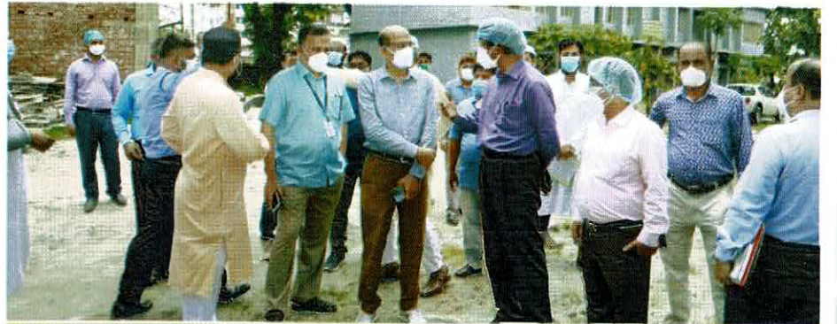
পরিদর্শনকালে বিভিন্ন বিষয়ে আলোচনা ও দিক নির্দেশনা প্রদান করেন বিদ্যুৎ বিভাগের মাননীয় সচিব মহোদয়

হিসাবে মনপুরায় ৩.০০ (তিন) মেঃ৩ঃ সোলার-ডিজেল হাইব্রিড বিদ্যুৎ কেন্দ্র স্থাপনের উদ্যোগ গ্রহণ করা হয়েছে। প্রায় শত কোটি টাকা ব্যয়ে মুজিব শতবর্ষেই স্পন্সর কোম্পানি IDCOL -এর মাধ্যমে বিদ্যুৎ কেন্দ্রটি স্থাপন করা হবে।