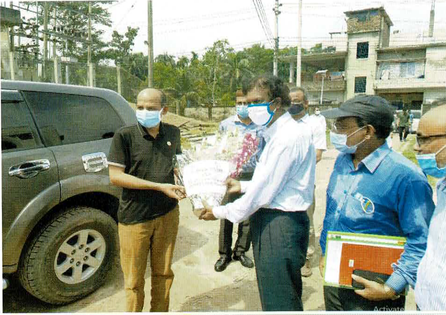
সচিব, বিদ্যুৎ বিভাগ মহোদয়কে ফুলেল শুভেচ্ছা জানাচ্ছেন ওজোপাড়িকো'র ব্যবস্থাপনা পরিচালক