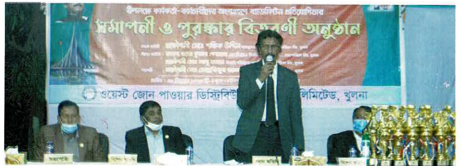
মহান বিজয় দিবস উপলক্ষে আয়োজিত ওজোপাডিকো'র কর্মকর্তা-কর্মচারীদের ব্যাডমিন্টন টুর্নামেন্টে বিজয়ী ও অংশগ্রহণকারীদের মাঝে পুরস্কার বিতরণী অনুষ্ঠানে উপস্থিত প্রধান অতিথি ওজোপাডিকো'র ব্যবস্থাপনা পরিচালকসহ অন্যান্য অতিথিগণ

পরিচালক (অর্থ), নির্বাহী পরিচালক (প্রকৌশল) ও প্রধান প্রকৌশলী (ইএসসিএন্ডএস) মহোদয়। আলোচনা সভায় অংশগ্রহণ করেন এসপিডিএসপি প্রকল্পের উপ-