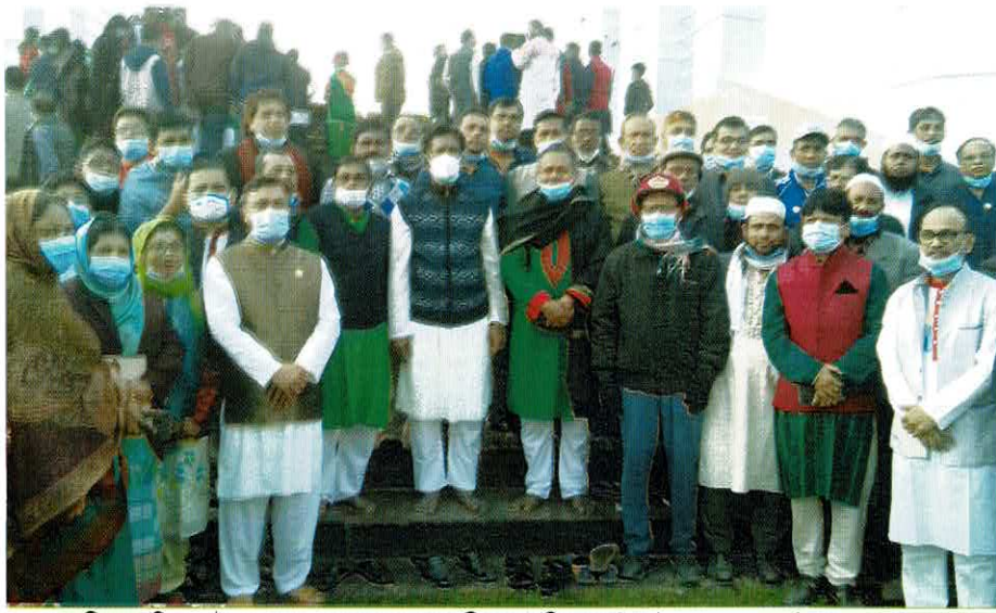
মহান বিজয় দিবস উপলক্ষে খুলনাস্থ গল্পামারীতে শহীদ স্মৃতিসৌধে পুষ্পার্ঘ্যের মাধ্যমে মুক্তিযুদ্ধে শহীদদের প্রতি সম্মান জানানো হয়