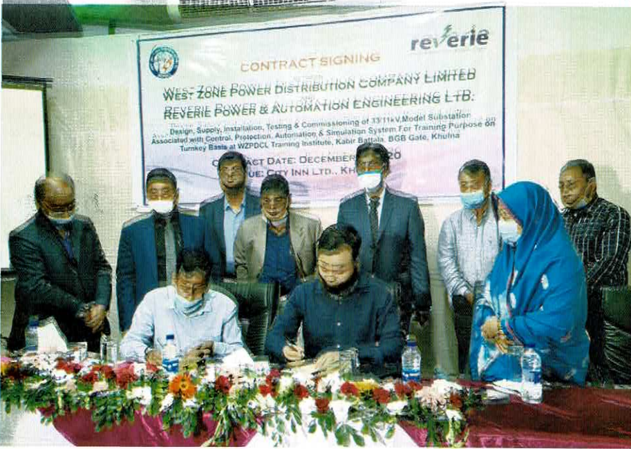
ওজোপাডিকো'র সহিত রিভেরি পাওয়ার ইঞ্জিনিয়ারিং লিঃ-এর সাথে একটি চুক্তি স্বাক্ষরিত

গত ৬ ডিসেম্বর, ২০২০ ইং তারিখে ওজোপাডিকো ট্রেনিং ইন্সটিটিউটে একটি ৩৩/১১ কেভি মডেল উপকেন্দ্র নির্মাণ কাজের জন্য ওজোপাডিকো'র সহিত রিভেরি পাওয়ার ইঞ্জিনিয়ারিং লিঃ-এর সাথে একটি চুক্তি স্বাক্ষরিত হয় খুলনাস্থ হোটেল সিটি ইন-এ।