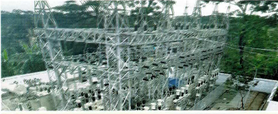
নতুন দুইটি ৩৩/১১ কেভি উপকেন্দ্রের কমিশনিং কাজ সম্পন্ন হয়েছে