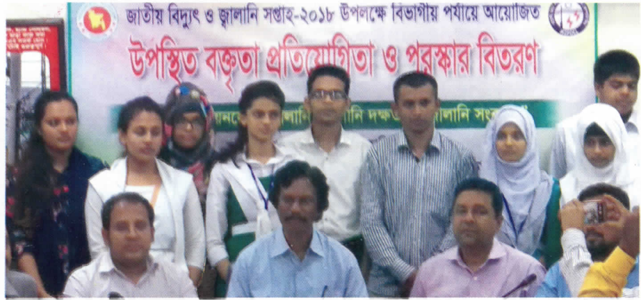
জাতীয় বিদ্যুৎ ও জ্বালানী সপ্তাহ-২০১৮ বজ্রতা প্রতিযোগিতায় বিজয়ী ছাত্র-ছাত্রীদের সাথে ওজোপাডিকোর ব্যবস্থাপনা পরিচালক মহোদয়সহ বিচারক মন্ডলী।

জাতীয় বিদ্যুৎ সপ্তাহ-২০১৮ উপলক্ষে ওয়েস্ট জোন পাওয়ার ডিস্ট্রিবিউশন কোম্পানি আয়োজিত "নবায়নযোগ্য জ্বালানী, জ্বালানী দক্ষতা ও জ্বালানী সংরক্ষণ" শীর্ষক মহানগর ও বিভাগীয় পর্যায়ে বজ্রতা প্রতিযোগিতা অনুষ্ঠিত হয়েছে। গত ২৫.০৭.২০১৮ খ্রিঃ তারিখ বুধবার বেলা ১১ ঘটিকায় ওজোপাডিকো, সদর দপ্তর খুলনা এর সম্মেলন কক্ষে এ প্রতিযোগিতা অনুষ্ঠিত হয়। উক্ত প্রতিযোগিতায় খুলনা বিভাগের অন্তর্গত বিজয়ী