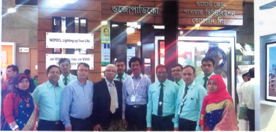
ঢাকা আন্তর্জাতিক কনভেনশন সিটি বসুন্ধরায় ওজোপাডিকোর স্টলের সামনে অতিথির সাথে প্রতিষ্ঠানের কর্মকর্তাবৃন্দ।