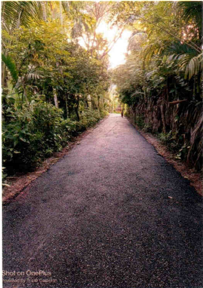
Shot on OnePlus Powered by Triple Camera