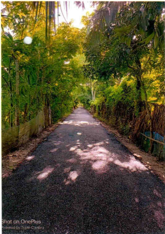
Shot on OnePlus Powered by Triple Camera